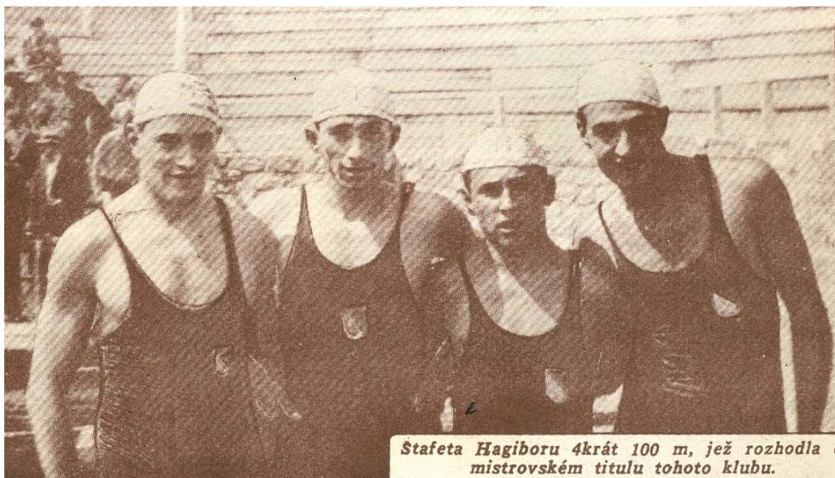
Obr. 3 Plavci Hagiboru v roce 1931